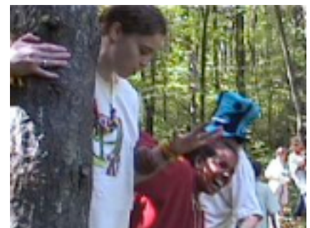
Les garçons et les filles suivent leurs DLJC distinct, sur la même propriété